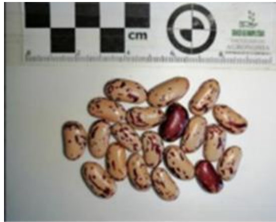
P. vulgaris 1977