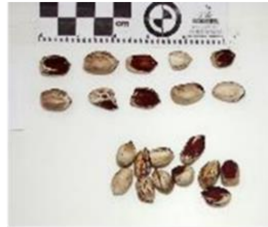
A. hypogaea 1985